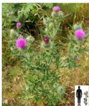
Cirse vulgaire Cirsium vulgare

La Municipalité rappelle l'obligation de tout propriétaire d'éliminer les plantes nuisibles telles que chardons des champs, cirses vulgaires et cirses laineux. Ces plantes doivent être anéanties avant la formation des graines.