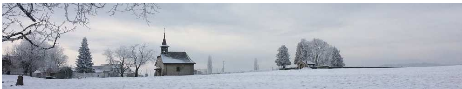
La Municipalité Vucherens, le 6 décembre 2017

Au plaisir de se rencontrer dans la joie de Noël.