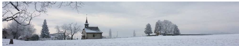
La Municipalité Vucherens, le 6 décembre 2017

Au plaisir de se rencontrer dans la joie de Noël.